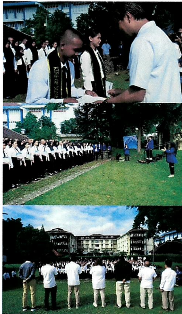
Gambar 2.4. Kegiatan Pelantikan Mahasiswa Baru TA 2025-2026