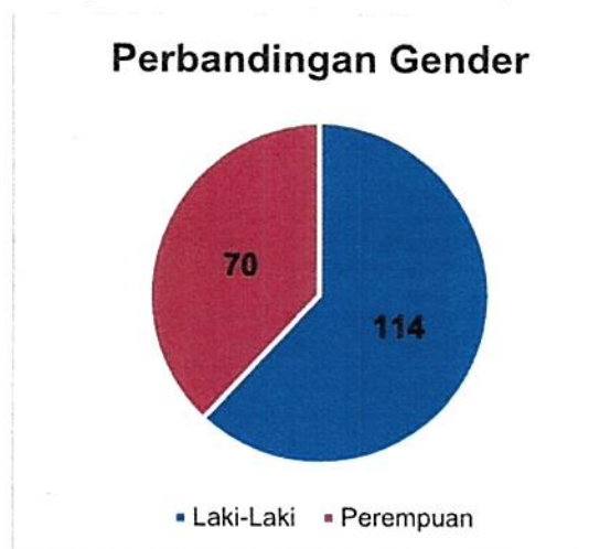
Gambar 2.1. Sebaran Mahasiswa TA 2025/2026 Berdasarkan Jenis Kelamin

Berdasarkan asal sekolah, jumlah calon mahasiswa baru yang berasal dari SMA sebanyak 142 mahasiswa, berasal dari SMK sebanyak 30 mahasiswa, dan berasal dari MA/Pesantren sebanyak 12 mahasiswa.