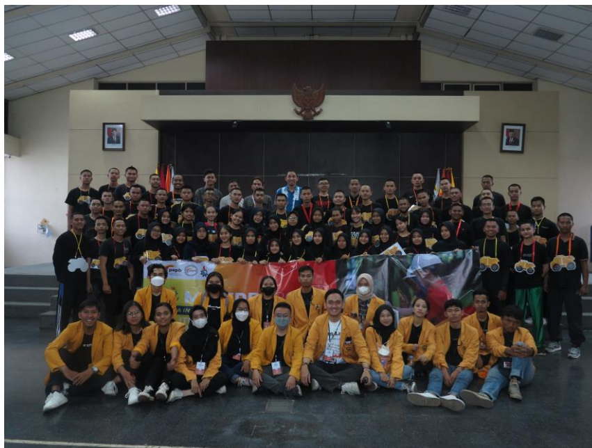
Gambar 2.2. Pelaksanaan MINERBA (Masa Internalisasi Mahasiswa Baru)

Kegiatan MINERBA dilaksanakan pada tanggal 18 – 19 Agustus 2022 secara daring melalui zoom meeting . Adapun kegiatan yang diberikan pada pelaksanaan MINERBA adalah sebagai berikut :