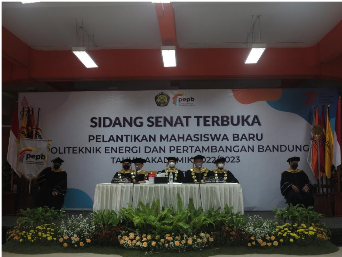
Gambar 2.4. Kegiatan Pelantikan Mahasiswa Baru Tahun Akademik 2022/2023

Adapun kegiatan sidang terbuka pelantikan mahasiswa baru Politeknik Energi dan Pertambangan (PEP) Bandung tahun akademik 2021/2022 adalah: